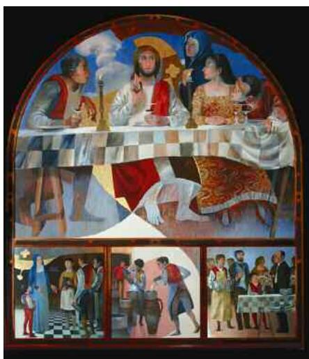
Arcabas, Le nozze di Cana