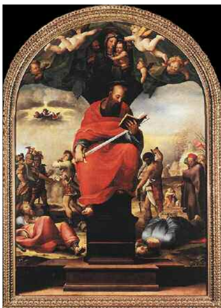
Domenico Beccafumi, San Paolo Chiesa di San Domenico - Siena

Egli nasce a Tarso, una città della Cilicia crocevia tra oriente e occidente, piena di fermenti filosofici e religiosi, e nella quale è presente anche una comunità ebraica. Egli appartiene ad una famiglia ebraica, verosimilmente di ispirazione farisaica. In Fil 3,5-6, vantando la propria origine ebraica, afferma di essere ebreo da ebrei, della stirpe d'Israele e, ancor più precisamente, della tribù di Beniamino. Nello stesso passo dichiara la propria adesione alla corrente farisaica. Tutto ciò spiega perché il giovane Saulo abbia voluto formarsi nella conoscenza della Tòrah e della tradizione ebraica, seguendo la scuola di Gamaliele II, il più grande rabbino fariseo dell'epoca. Così egli si presenta in At 22.: « Io sono un Giudeo, nato a Tarso di Cilicia, ma cresciuto in questa città, formato alla scuola di Gamaliele nelle più rigide norme della legge paterna, pieno di zelo per Dio, come oggi siete tutti voi ».