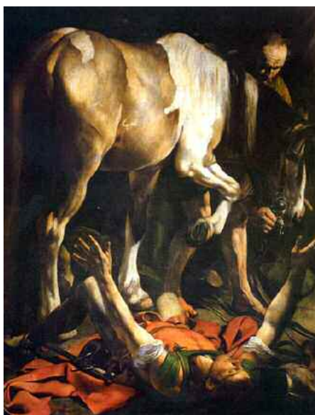
Caravaggio, Conversione di San Paolo - Chiesa di Santa Maria del Popolo - Roma

Ecco il tema a cui faranno riferimento i diversi aspetti del nostro cammino comunitario quest'anno. Intendiamo la parola "tema" non nel significato scolastico, in riferimento a un