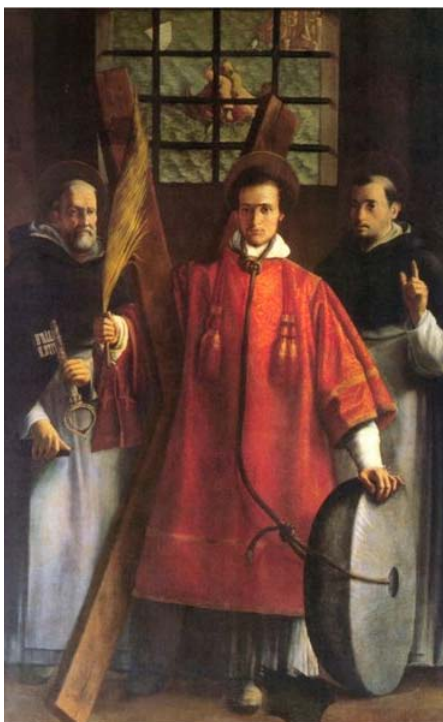
Anonimo, San Vincenzo di Saragozza in prigione, Sec. XVII