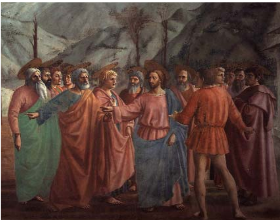
Masaccio, Il tributo - Cappella Brancacci - Firenze

Il prossimo appuntamento, riservato ai ragazzi di prima media, si terrà nella settimana dal 5 al 9 febbraio 2007.