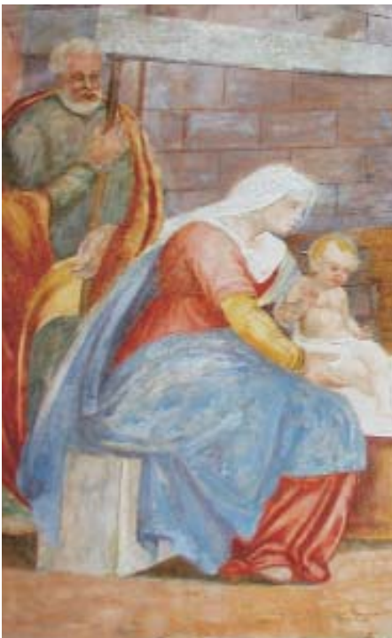
Ettore Pirovano, Adorazione dei Magi (particolare) Chiesa Madonna dei Campi - Zanica