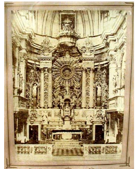
Il nostro Triduo, in una fotografia di alcune decine di anni fa.