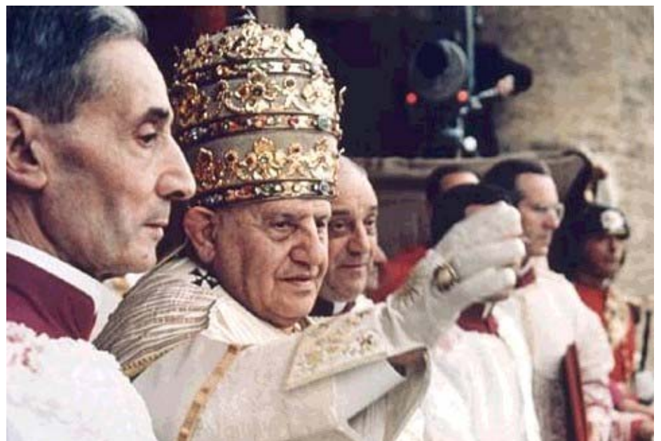
Papa Giovanni XXIII nel giorno della sua incoronazione