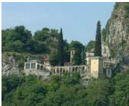
"La Valletta" a Somasca