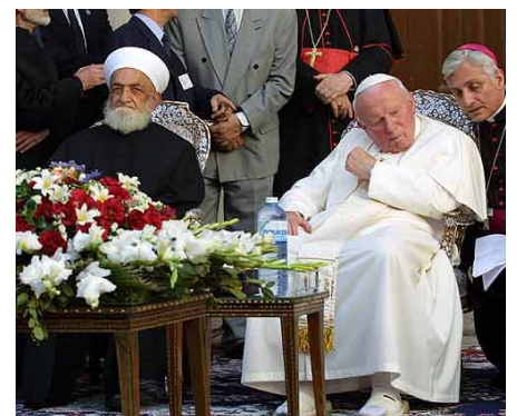
L'incontro tra Papa Giovanni Paolo II e il Mufti di Siria, durante la storica visita alla moschea di Damasco nel 2001

Fulvio Scaglione (da "Avvenire" del 21/02/2006)