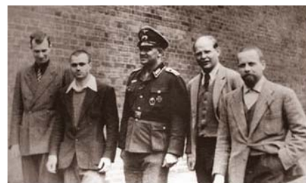
Bonhoeffer (secondo da destra) nel carcere di Tegel, nel 1943