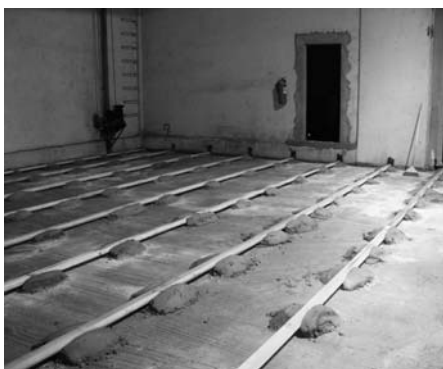
I lavori di "armatura" e "gettata" della soletta del cineteatro

1. È iniziata la "campagna finanziamento" per il restauro della chiesa parrocchiale . In questi giorni inizieranno ad essere distribuiti dei dépliant con illustrati i vari lotti dell'intervento con i relativi costi e anche le diverse forme possibili di contribuzione. La cosa interessante è certamente la possibilità di dedurre dalla dichiarazione dei redditi quanto viene donato per questo progetto approvato dalla Sovrintendenza. Intanto qualcosa "si muove". Singoli parrocchiani hanno iniziato a dare offerte espressamente destinate al restauro, dai 40 € ai 50, 200, 500, 1.500 e 2.000 €. Anche gruppi e associazioni mostrano un significativo interesse: dapprima un gruppo di giocatori del Totocalcio e poi l'Associazione Cacciatori, che ha destinato al restauro una parte dei proventi della loro festa estiva. Sono iniziati anche i contatti diretti con imprenditori e aziende.