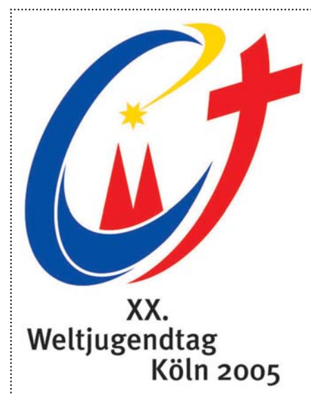
Il logo della GMG 2005