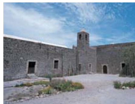
L'antica missione di Ciudad Constitucion