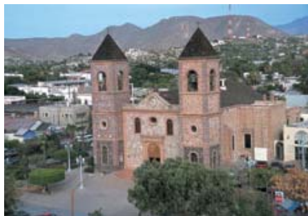
Uno scorcio di La Paz

Il martedì successivo, nel primo pomeriggio, ho lasciato la parrocchia, diretto a La Paz. Mi accompagnavano tre giovani, che erano alcuni degli Accoliti della parrocchia. Solo un gruppetto di persone era venuto a salutarmi. La cosa mi ha sorpreso abbastanza; però mi son detto: "Già mi hanno salutato la domenica". Partiamo. A circa 12 chilometri al sud della città, il giovane che conduceva l'automobile comincia a suonare il clacson. "Che ti succede?", gli domando. Mi accorgo che poco avanti c'è una macchina della polizia, a sirene spiegate. E c'è anche un folto gruppo di persone della parrocchia, che si erano riunite per salutarmi. Altri abbracci e altre lacrime. Il viaggio è proseguito senza altri intoppi, fino ad arrivare a La Paz. Abbiamo scaricato i bagagli. E poi altri abbracci e lacri-