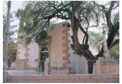
Il santuario del "Corazon de Jesus"

me da parte dei tre Accoliti che mi avevano accompagnato e che si accingevano a ritornare a Ciudad Constitucion. Appena si è diffusa la notizia che ero arrivato a La Paz, è cominciata la processione degli antichi amici di qui: processione che non è ancora terminata.