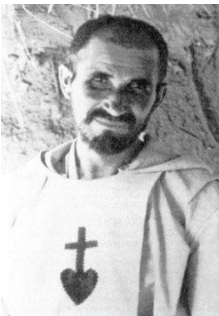
Charles de Foucauld (1858-1916)

Ed è per me un'esigenza d'amore il donarmi, il rimettermi nelle tue mani senza misura, con una confidenza infinita, poiché tu sei il Padre mio.