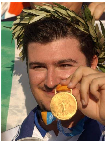
Marco Galiazzo, vincitore della medaglia d'oro nella gara di tiro con l'arco individuale alle Olimpiadi di Atene 2004. Una delle medaglie più belle e inattese di questi Giochi...