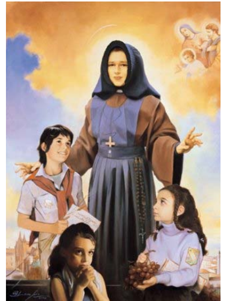
Santa Paola Elisabetta Cerioli (1816-1865)

La fondatrice dell'Istituto della Sacra Famiglia