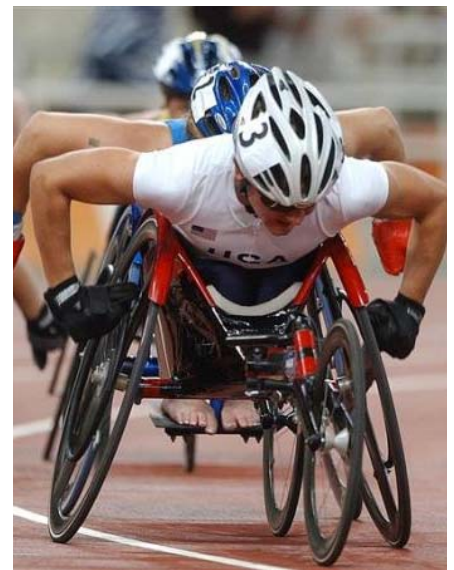
Le atlete della gara degli 800 metri, alle Paralimpiadi di Atene 2004