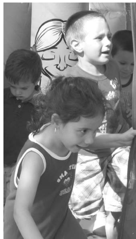
Alcuni dei bambini che hanno partecipato all' "Open Day" Domenica 28 agosto

Gli incontri si svolgeranno alle ore 21.00 presso il Salone Rosa dell'Oratorio San Giovanni Bosco - Ingresso libero