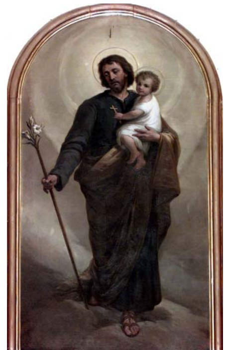
San Giuseppe Chiesa delle Capannelle - Zanica