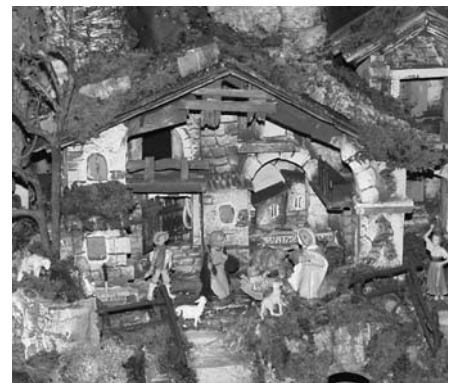
Un particolare del presepio alla Scuola Materna