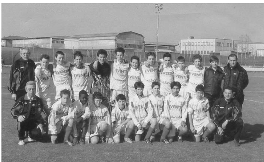
La squadra dei Giovanissimi - Anno 2002/2003