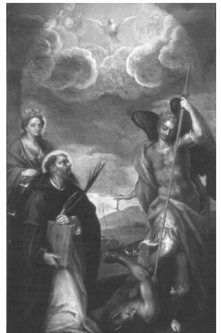
Sante Peranda, San Michele Arcangelo che sconfigge il demonio, tra S. Pietro martire e S. Caterina di Alessandria Chiesa Parrocchiale di Zanica

Speriamo di poter presto rendere accessibile a tutti il suo pregevole lavoro.