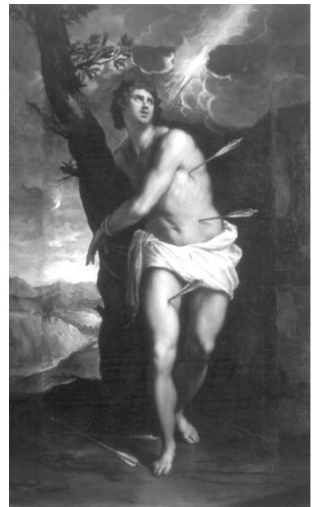
Palma il Giovane, San Sebastiano Chiesa parrocchiale di Zanica

b. Nei giorni feriali la messa ha un orario più vario, non solo per esigenze organizzative, ma perché vorremmo offrire a più persone, a più “categorie” di fedeli l'opportunità almeno di una messa feriale, scelta come sostegno per il proprio cammino di fede. La messa ogni settimana all'oratorio, in particolare, potrebbe essere una opportunità preziosa per gli adolescenti e per i giovani, oltre che per tutti coloro che amano fattivamente il nostro oratorio.